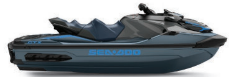
Blue Abyss and Gulfstream Blue